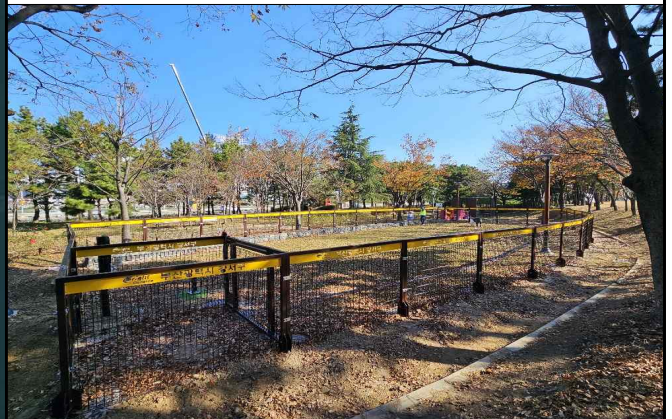
② 대형견용 놀이터